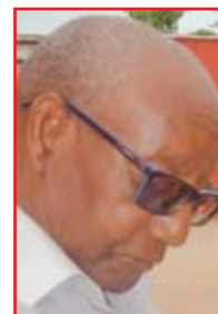
Por: Miguel Sumburane

Ó Norte! Dá-me a bela Rosa. Aquele que, no desmaiar Do Sol, abandonei, chorosa.